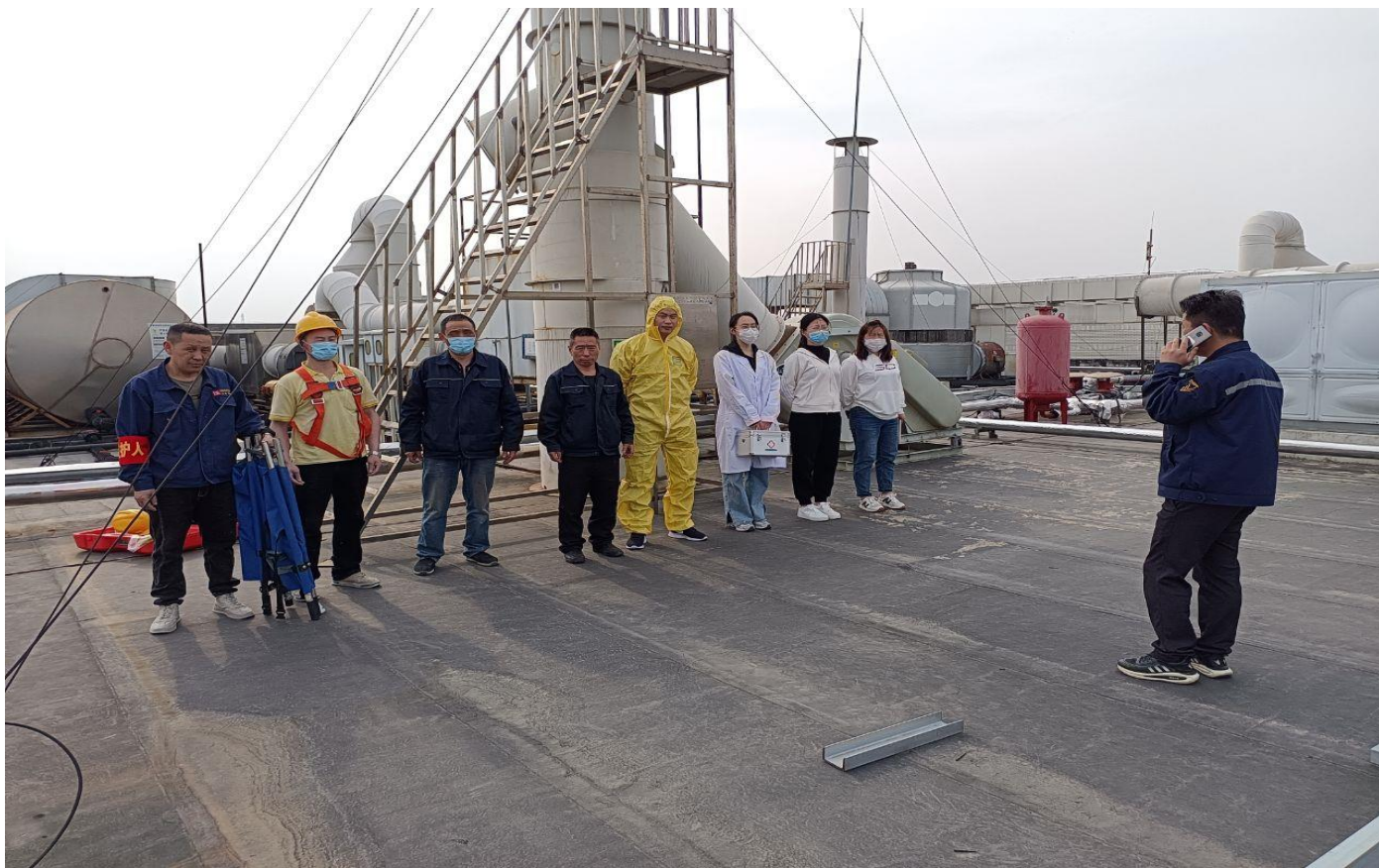
图片说明：应急演练结束，总指挥进行总结。