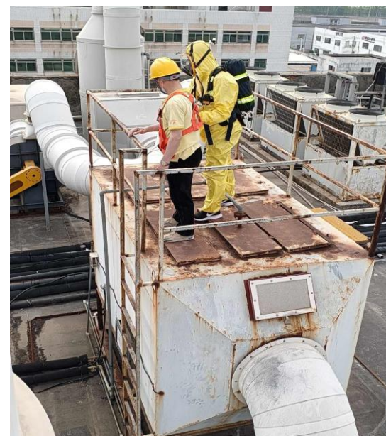
图片说明：救援人员上去展开救援；