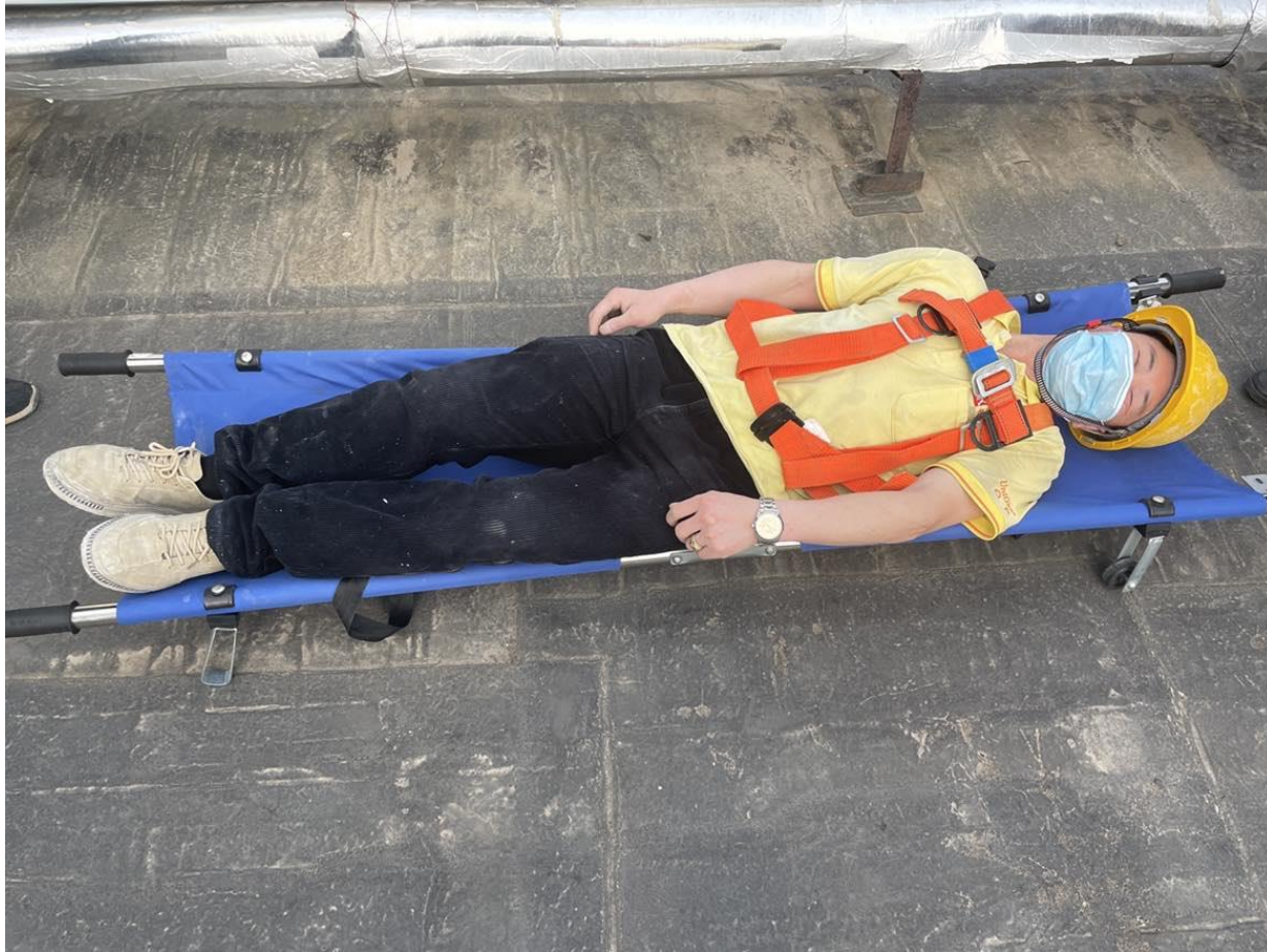
图片说明：人员救出后立即将其移至空气流通好的地带